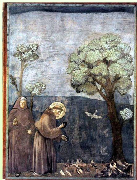
Saint François d'Assise, diacre. Décédé le 3 octobre 1226

Dieu envoie son Esprit Source de toute grâce Il vient guider nos pas Et fait de nous des saints. R